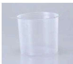
ビックさげ缶カバー