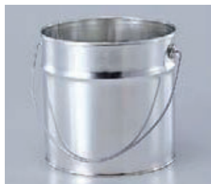
プロ缶 (重ねられます)